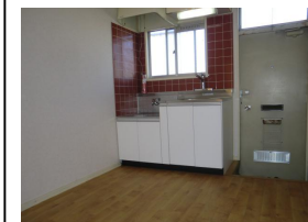
キッチンスペース