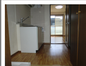
キッチンスペース